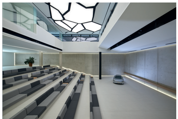
© Oliver Hallwirth, www.raumpixel.at für Fill Gesellschaft m.b.H. Innenausbau: baier + demmelhuber